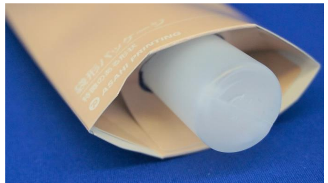
② 底の開口部から収容物を押し入れる