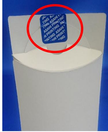
図2 従来の封緘方法 (ラベル等の封緘)