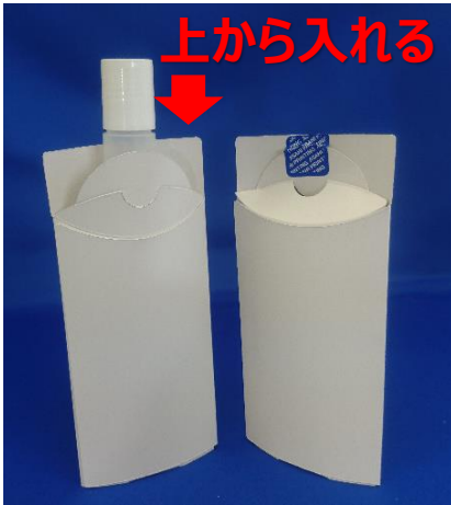
図1 従来の紙製曲面形状パッケージ