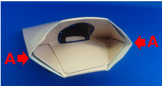
① 両端Aを内側に押し湾曲させる