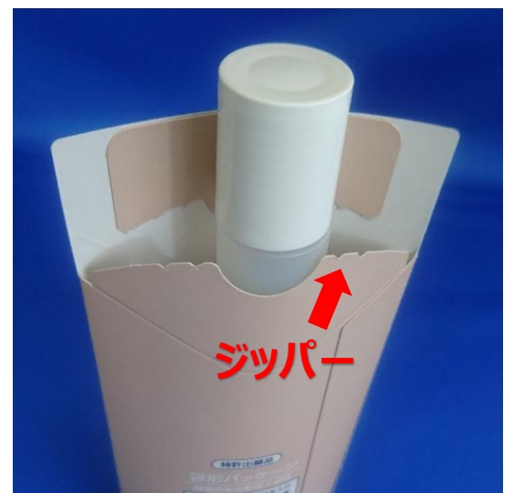
背面のジッパーを開封