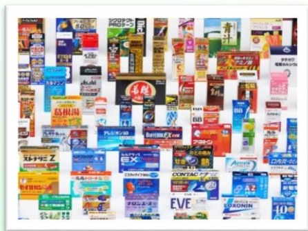
店頭医薬品向けパッケージ